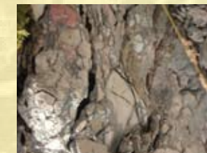
breča (Jelarska breča)