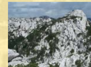
breča (Jelarska breča)