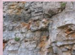
dolomit (haupt dolomit)