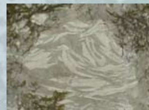
vapnenac (lithiotis vapnenac)