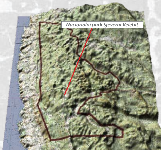
Nacionalni park Sjeverni Velebit

KRŠ je poseban tip reljefa koji nastaje uslijed kemijskog trošenja karbonatnih stijena pod utjecajem vode u kojoj je otopljen ugljični dioksid. Taj proces nazivamo okršavanjem .