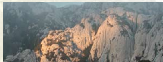
Vrhovi Sjevernog Velebita danas

JAME - vertikalni podzemni sustavi nastali djelovanjem vode u tektonski razlomljenim terenima. Područje Parka danas je i u svijetu poznato po velikom broju jama od kojih su neke dublje od tisuću metara.