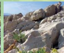
vapnenac (rudistni vapnenac)