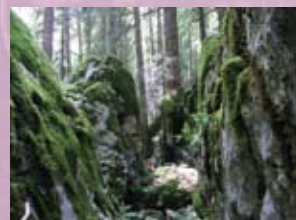
vapnenac (diploporni vapnenac)