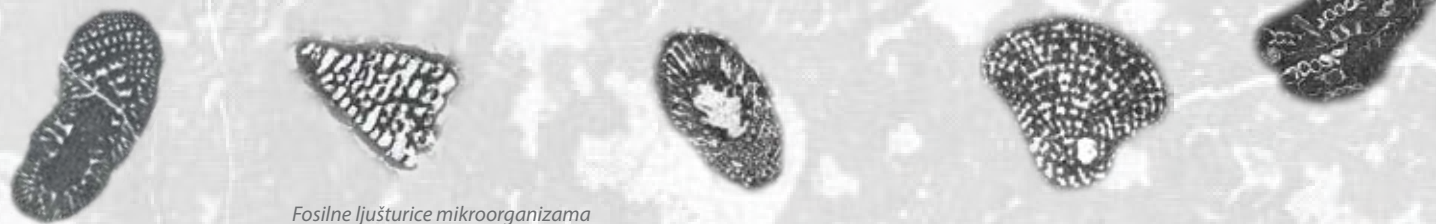
Fosilne ljušturice mikroorganizama

Tako je započelo formiranje i rast planine na čijoj se površini danas, na području NP Sjeverni Velebit, mogu vidjeti naslage različitih starosti, od srednjega trijasa (prije 237 mil. god.), pa do kvartara, tj. do danas. Zbog toga vi u samo jednom koraku možete preskočiti i desetke milijuna godina.